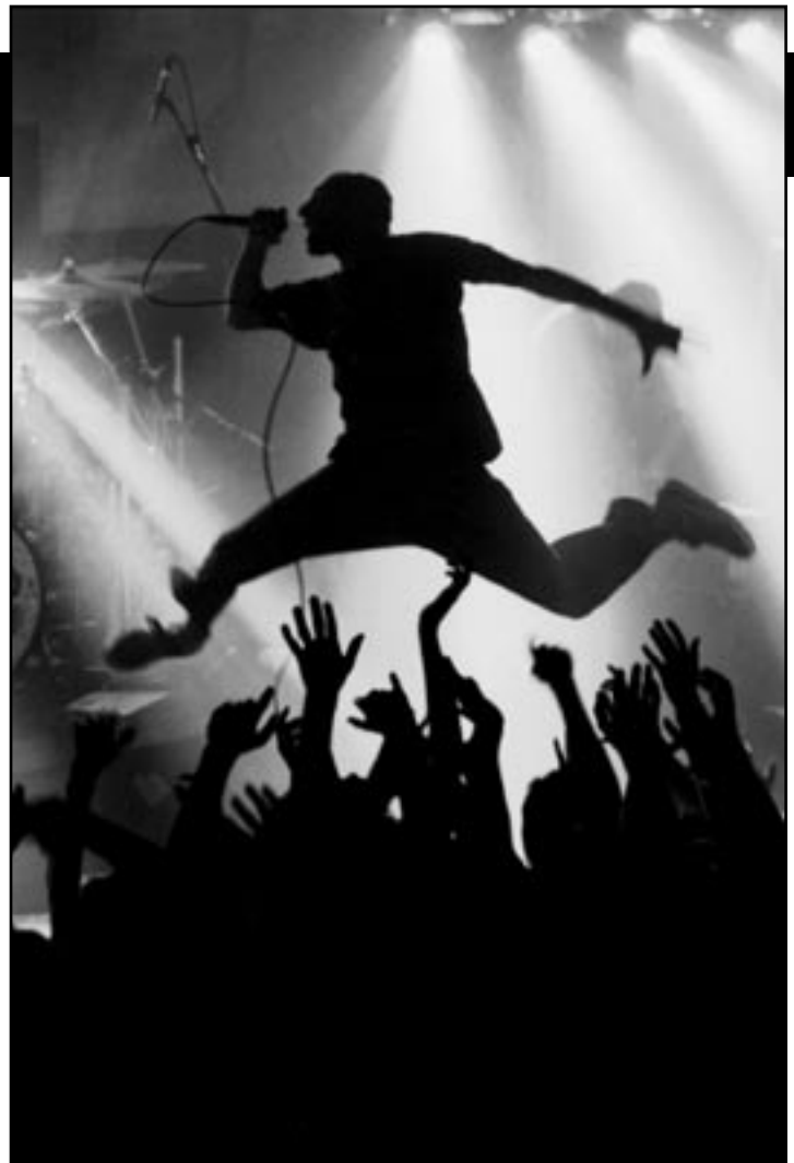
No One Is Innocent - Novembre 1997