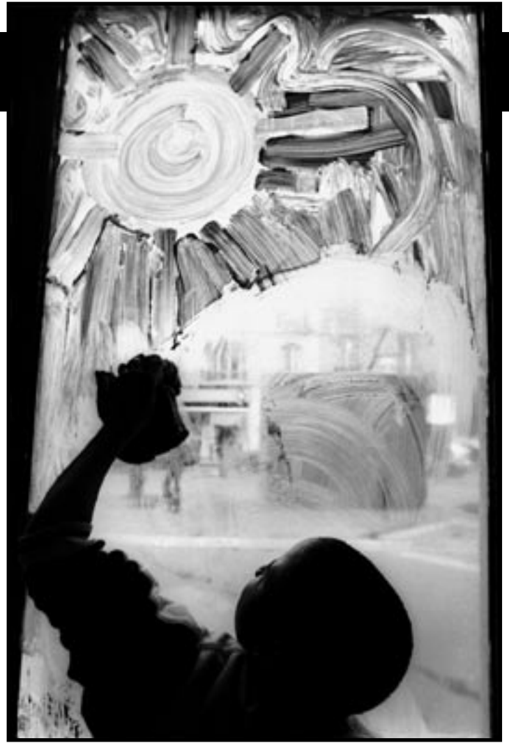
Centre social AIRE 10 - Paris, 2001

A travers le portrait et le reportage, photographe est pour lui un prétexte pour aller vers l'autre.